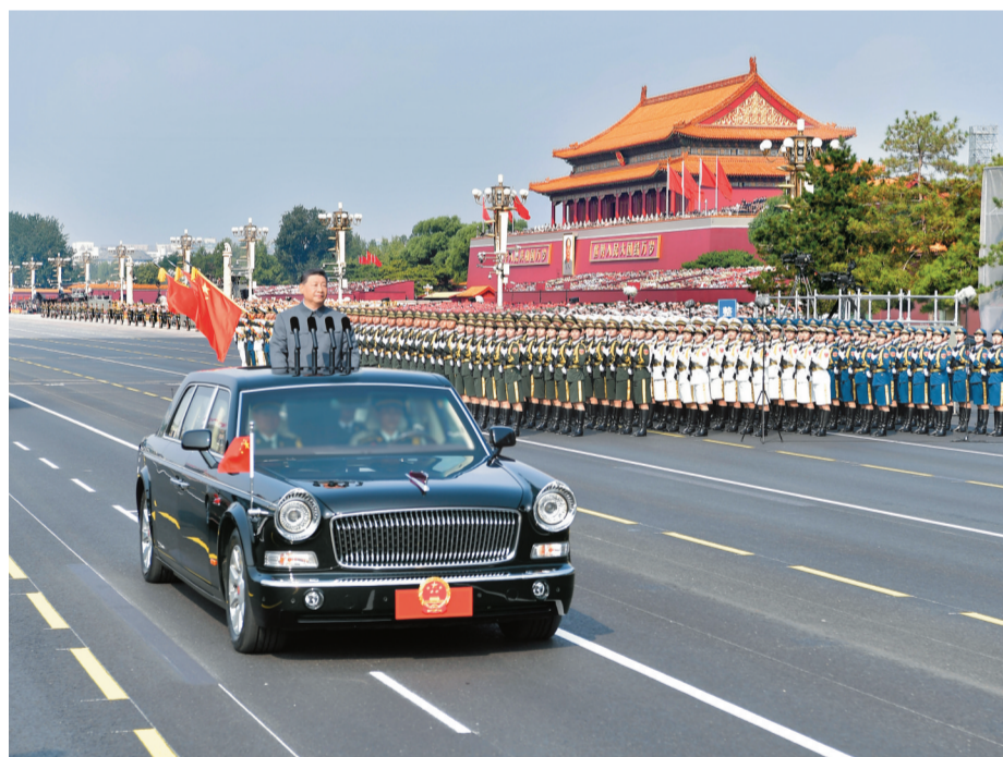
9月3日，纪念中国人民抗日战争暨世界反法西斯战争胜利80周年大会在北京天安门广场隆重举行。这是中共中央总书记、国家主席、中央军委主席习近平检阅受阅部队。